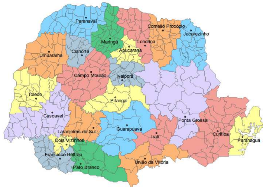
Figura 1 – Divisão política dos Núcleos Regionais da SEAB

O Valor Bruto da Produção (VBP) é um índice calculado pelo DERAL que representa o volume financeiro arrecadado pela agropecuária. Para o levantamento dos dados do VBP a SEAB conta com o apoio de 23 Núcleos Regionais, divididos conforme a Figura 1, com equipes que levantam dentro de suas áreas de abrangência o volume produzido e os valores de comercialização de cada um dos produtos que compõem o indicador. Essas duas variáveis (preço e produção) são as principais para o cálculo do índice.