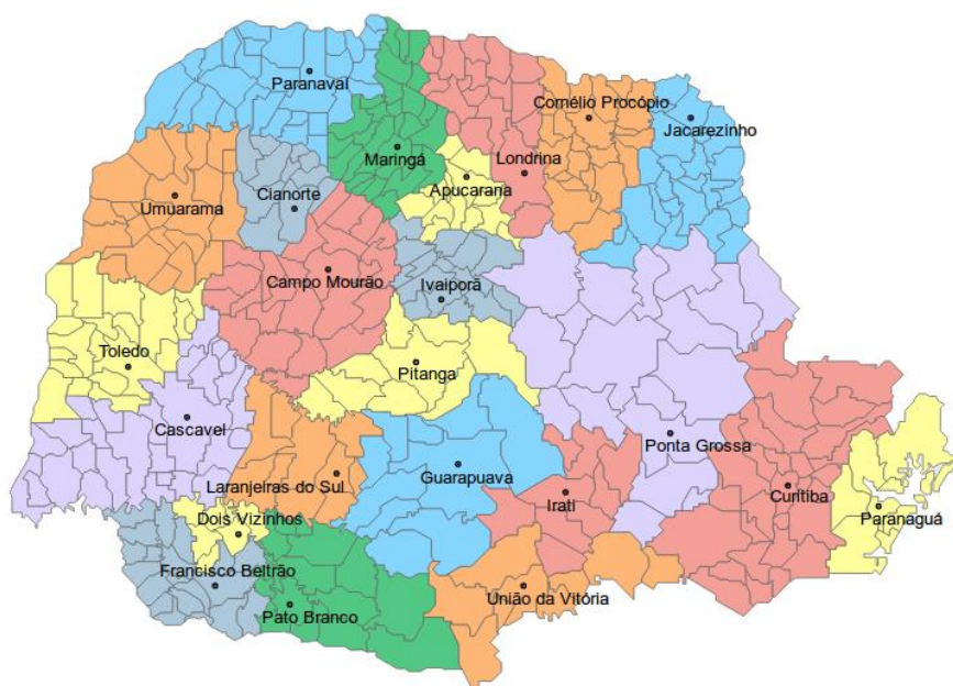
Figura 1 – Divisão política dos Núcleos Regionais da SEAB

O Valor Bruto da Produção (VBP) é um índice calculado pelo DERAL que representa o volume financeiro arrecadado pela agropecuária paranaense. Para o levantamento dos dados do VBP, a SEAB conta com o apoio de 23 Núcleos Regionais, divididos conforme a Figura 1, com equipes que pesquisam dentro de suas áreas de abrangência o volume produzido e os valores de comercialização de cada um dos produtos que compõem o indicador. Essas duas variáveis (preço e produção) são as principais para o cálculo do índice.