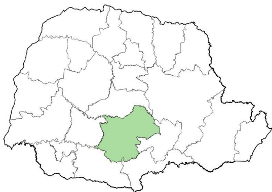
Figura 1. NÚCLEOS REGIONAIS DA SEAB

A principal cultura na região é a soja, ocupando a 1 a colocação no VBP (Tabela 1) de todos os municípios da regional a muito tempo. Ela é responsável por 36,1% do valor bruto desta safra. Em 2021 o valor desta oleaginosa foi de R$ 2,73 bilhões, apresentando crescimento de 65,6% em relação ao ano de 2020. Este aumento foi possível devido aos bons preços (elevação de 84,6%) desta commoditie durante o período.