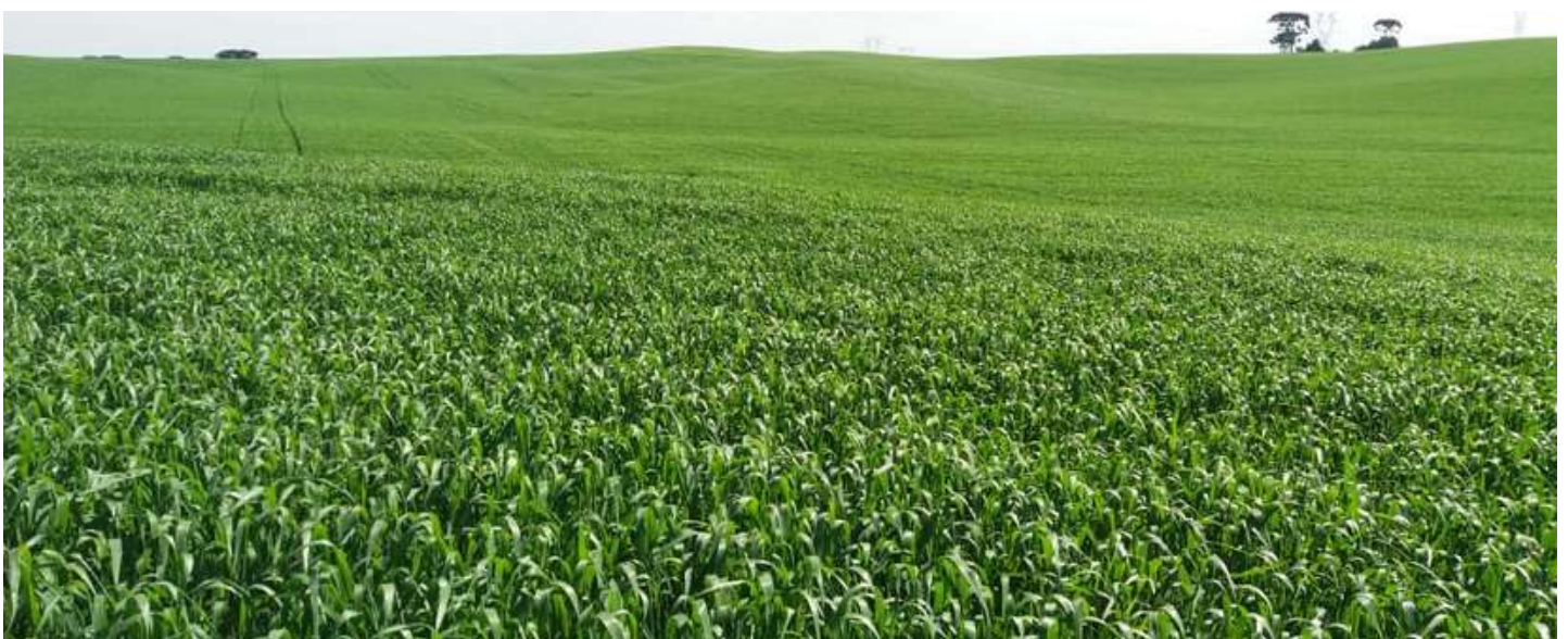
Trigo em D.V em Araucária, por Edson Kupka

Os produtores já estão trabalhando no preparo do solo para o plantio da safra de verão. Nesta safra poucos produtores estão optando pela cultura do milho, exceto aqueles que cultivam o produto para silagem e os produtores tradicionais de subsistência. A redução na área plantada deverá ser compensada pelo aumento no cultivo de soja.