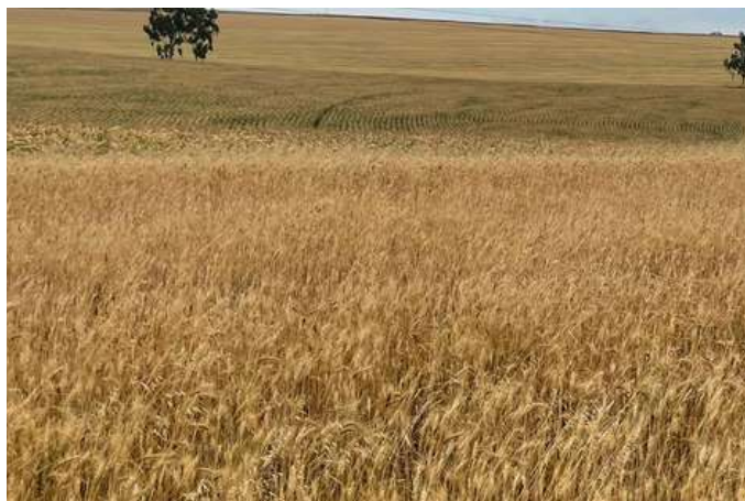
Trigo em Assaí, por Paulo Mileo

Os rios, riachos e represas apresentam uma boa lâmina de água, garantindo boas condições de irrigação e abastecimento para os reservatórios que fornecem água aos animais e aves de corte e postura.