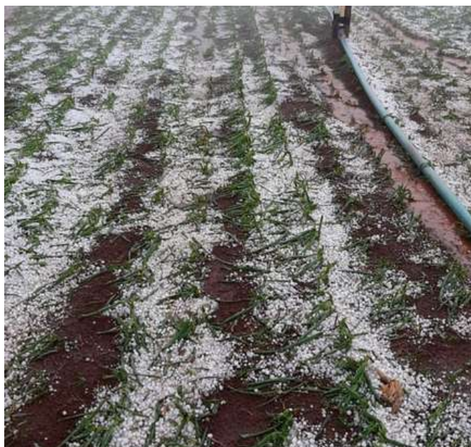
cebola no município de Pinhão, por Josnei Augusto

A colheita do café está em andamento, porém em ritmo lento, com variações significativas nas produtividades.