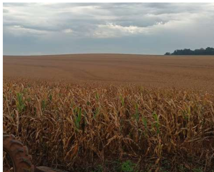
Milho em Maturação em Quinta do Sol, por Paulo Borges