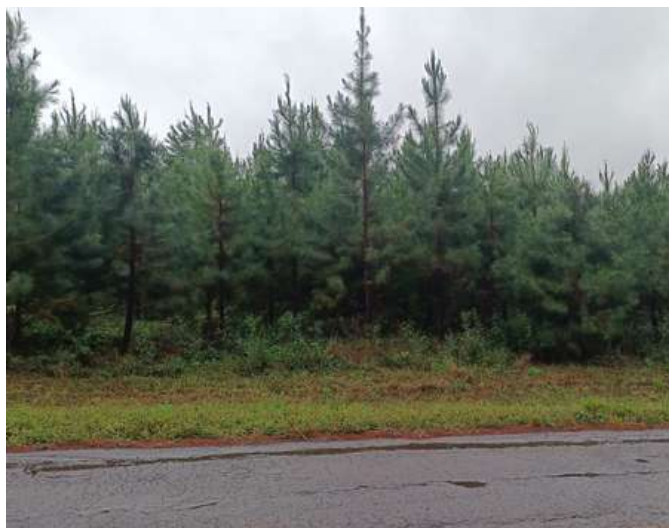
Pinus em Araruna, por Paulo Borges