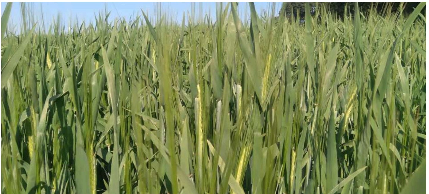
Cevada em floração em Carambeí

A comercialização da soja continua lenta, com os produtores aguardando melhores preços para o produto.