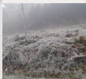
Geadas em União da Vitória