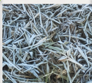
Geadas em Dois Vizinhos