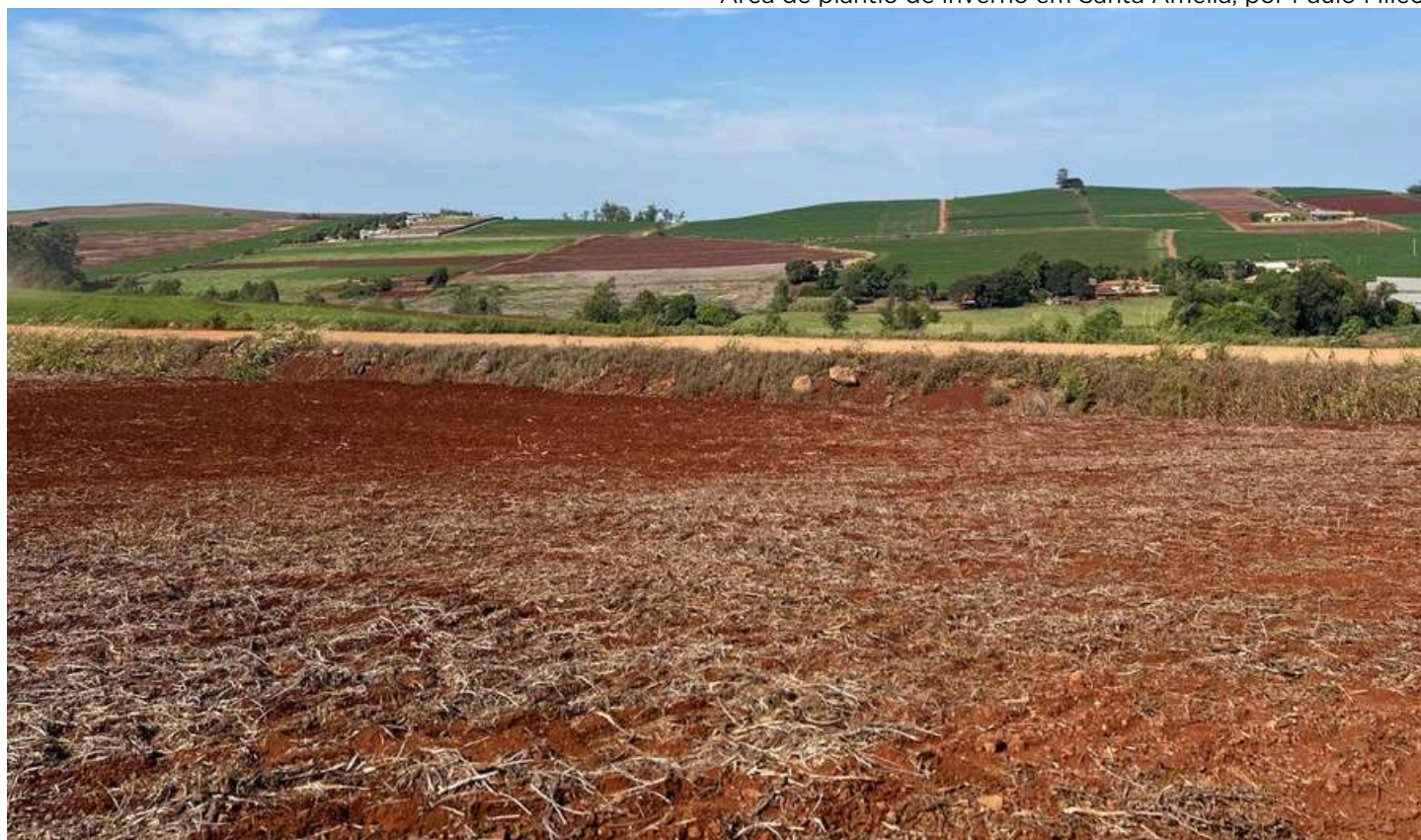
Área de plantio de inverno em Santa Amélia, por Paulo Mileo

As pastagens vêm apresentando melhora no desenvolvimento vegetativo, favorecidas pelas boas condições climáticas dos últimos dias, com temperaturas mais amenas.