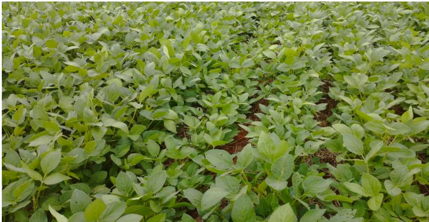
Soja em boas condições na Região dos Campos Gerais, Vantroba

A cultura atravessa fases críticas, com a maior parte das lavouras em frutificação e enchimento de grãos, além de áreas em floração e início de maturação. O cenário climático é misto: enquanto as chuvas recentes garantiram umidade em diversas regiões, o forte calor e a insolação provocaram estresse hídrico e térmico em localidades específicas, manifestado pelo enrolamento foliar. No aspecto sanitário, o controle de pragas, como ácaros e míldio, tem sido realizado com eficiência. A colheita já foi iniciada de forma pontual e ainda sem expressividade volumétrica, devendo ganhar ritmo nos próximos dias.