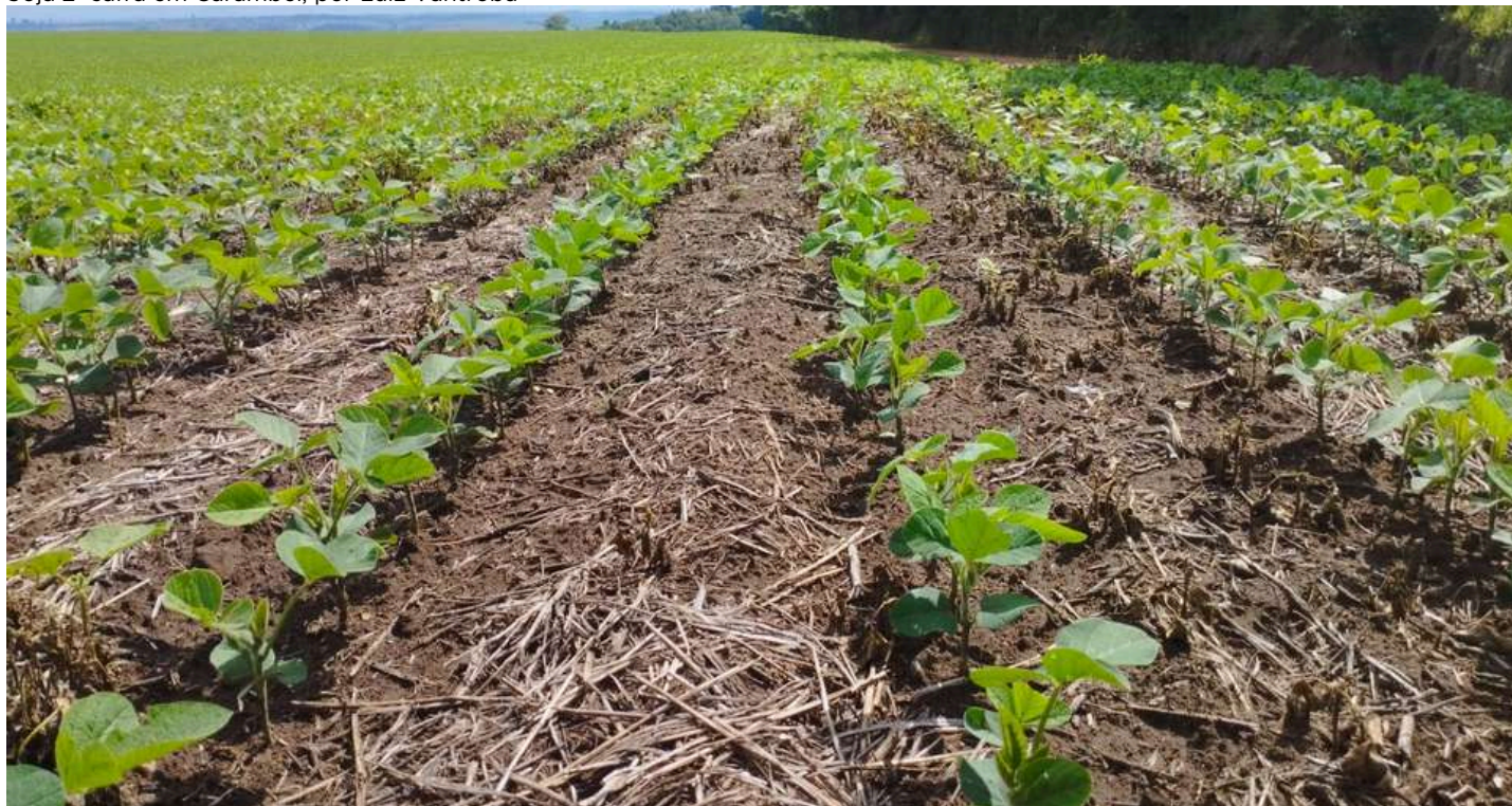
Soja 2ª safra em Carambeí, por Luiz Vantropa

A colheita está bastante avançada, com o envio das primeiras cargas às indústrias. As condições climáticas recentes têm permitido boa evolução das atividades no campo.