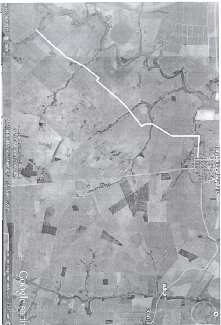
Figura 1 : Imagem obtida por satélite. Estrada da Água Grande