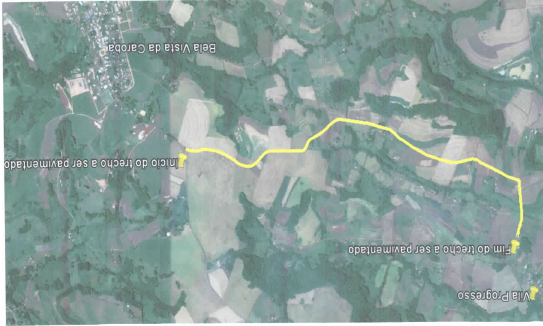
Trecho a ser pavimentado – Entrada da Plataforma da CLAF até Vila Progresso