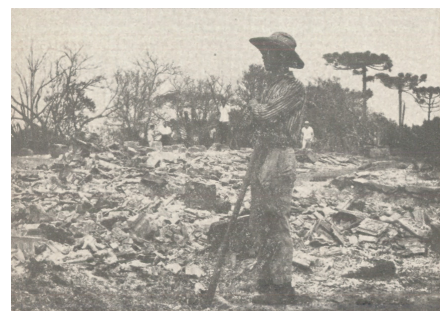
Foto 2 : agricultor desolado frente aos estragos causados pelo incêndio.

Um dos maiores eventos conhecidos, no Brasil, relativo a incêndios florestais, foi o grande incêndio ocorrido entre agosto e setembro de 1963, na região centro-oriental paranaense. Esse incêndio transformou em cinzas aproximadamente 2.000.000 de hectares, cerca de 10% da área do Estado do Paraná, destruindo florestas e outras formações nativas, cultivos florestais, além de mais de 5.000 casas e matando 110 pessoas 1 .