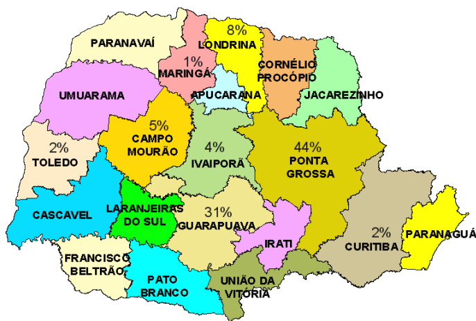
Figura 1: PARANÁ, DIVISÃO POLÍTICO ADMINISTRATIVA (SEAB) COM VOLUME DE ABATE DE OVINOS NO PERÍODO DE JANEIRO A AGOSTO DE 2010.

O Paraná conta hoje com 11 núcleos regionais que informam abate de ovinos. Dentre estes evidencia-se as localidades onde existem cooperativas de ovinocultores. No que se refere à volume de abate destacam-se as regiões de Ponta Grossa (44%), Guarapuava (31%) e Londrina (8%), que contam com as cooperativas Castrolanda, Cooperaliança e Coopercapana respectivamente.