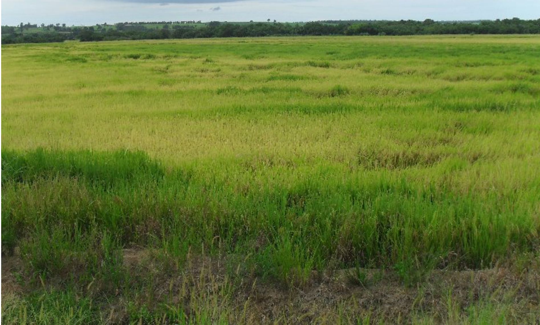
Foto de áreas cultivadas com arroz irrigado na região de Loanda