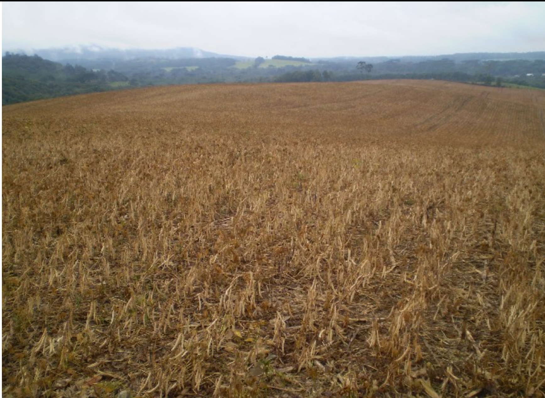
Foto de feijão das secas a ser colhido no município de Paula Freitas