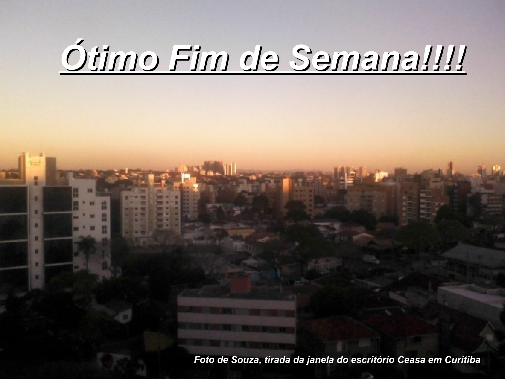
tirada da janela do escritório Ceasa em Curitiba