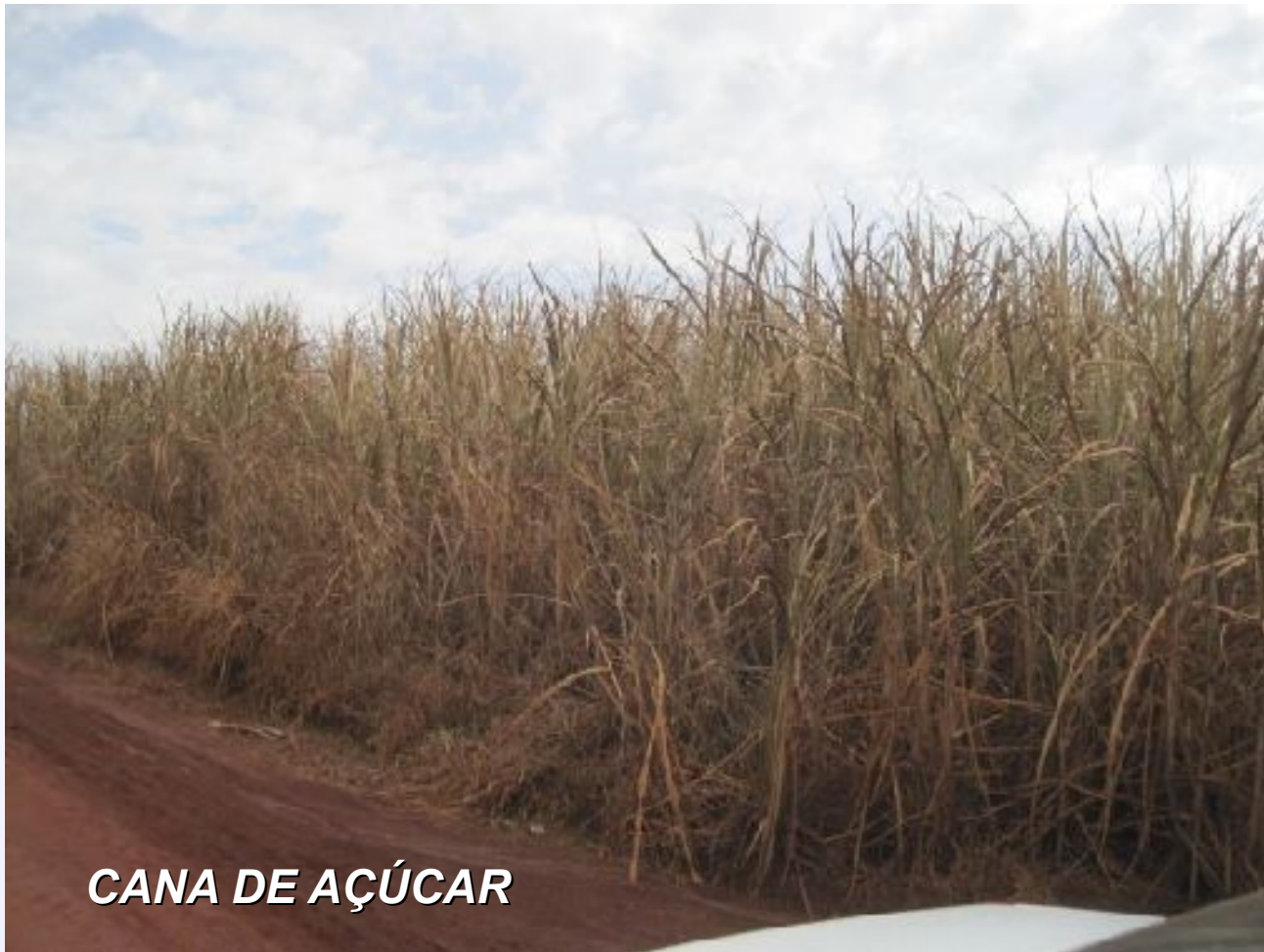
CANA DE AÇÚCAR