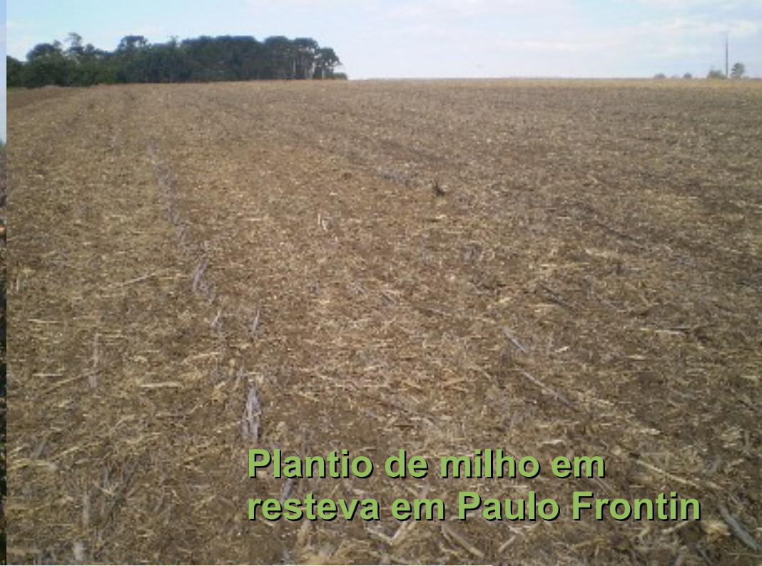
Plantio de milho em resteva em Paulo Frontin