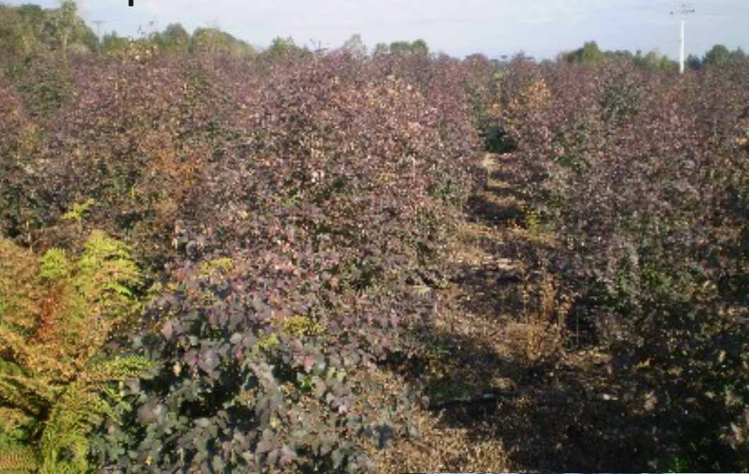
Plantio de eucalipto atingido pela geada Município de Paula Freitas