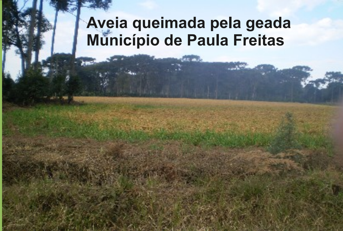
Aveia queimada pela geada Município de Paula Freitas