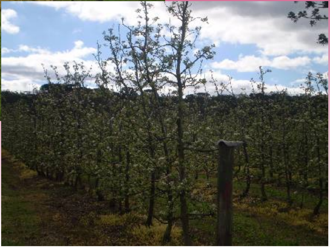
Maçã em Paula Freitas/PR