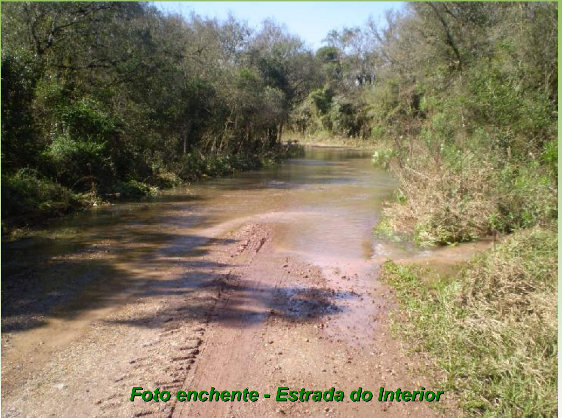
Foto enchente - Estrada do Interior