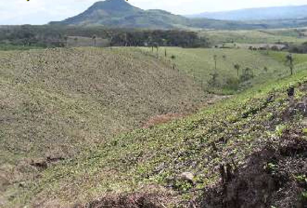
Feijão em terreno quebrado