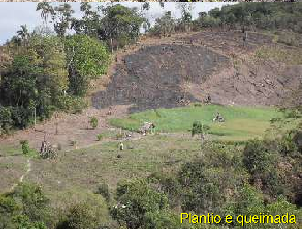
Plantio e queimada