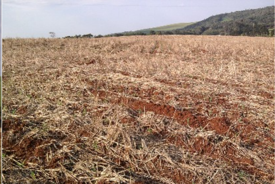
Fotos de cultivo de milho e trigo em Pato Branco