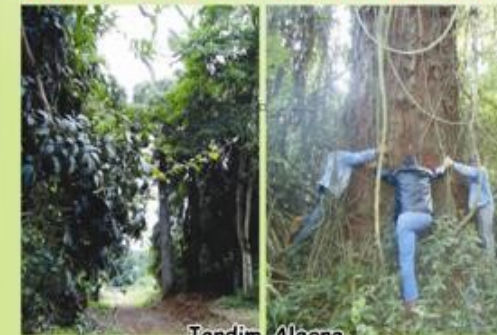
Jardim Alegre Paraná