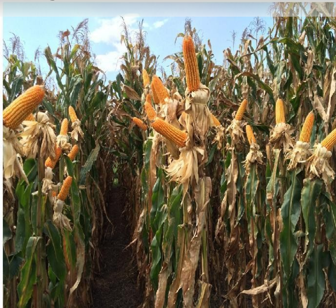
Milho - Castro - 04/03/2015 Carlos Salvador