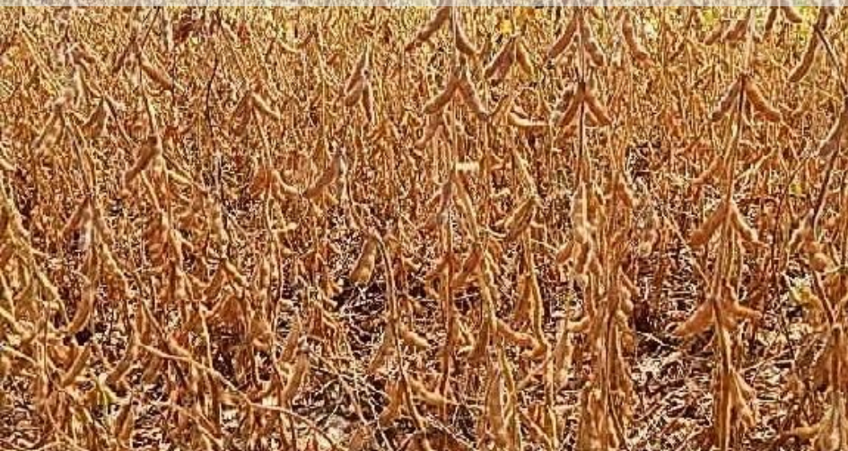
Soja - Lapa - 20/02/2015 Antonio C. Tonon